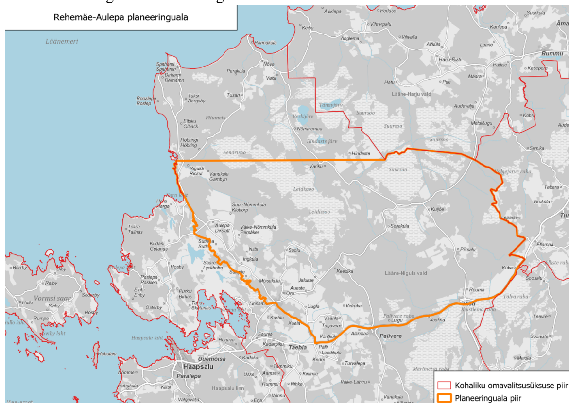
Joonis 2. EstLink 3 Rehema-Aulepa maismaa osa REP-i planeeringuala asukoht ja piir

Eelnõu punktis 3 esitatakse REP-i algatamisel teadaolev planeeringuala ja selle suurus, sh planeeringuala piir (joonis 2). REP planeeringuala hõlmab Lääne maakonnas osa Lääne-Nigula valda. Planeeringuala suurus on ligikaudu 513 km 2 .