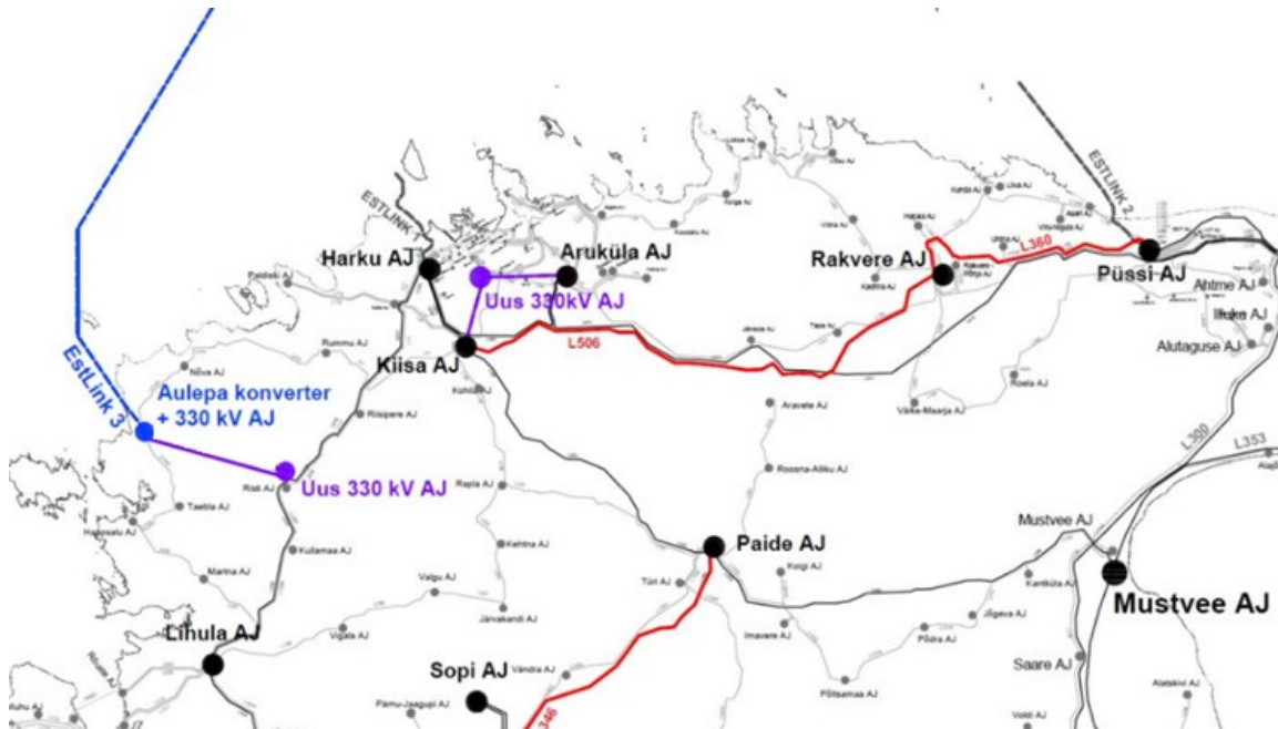
Joonis 1. Seoses EstLink 3 rajamisega võrgu üldine plaan

REP-i asukoha eelvaliku tegemisel tuleb kaaluda mitut võimalikku asukohta. Elektriühendusele otsitakse parimat asukohta kogu planeeringuala ulatuses. Elering on eelnevalt analüüsinud 15 liinikoridoride alternatiivide paigutamise võimalusi piirkonda (joonis 1), millest lähtuvalt on tehtud ka ettepanek planeeringuala ulatuse osas (joonis 2).